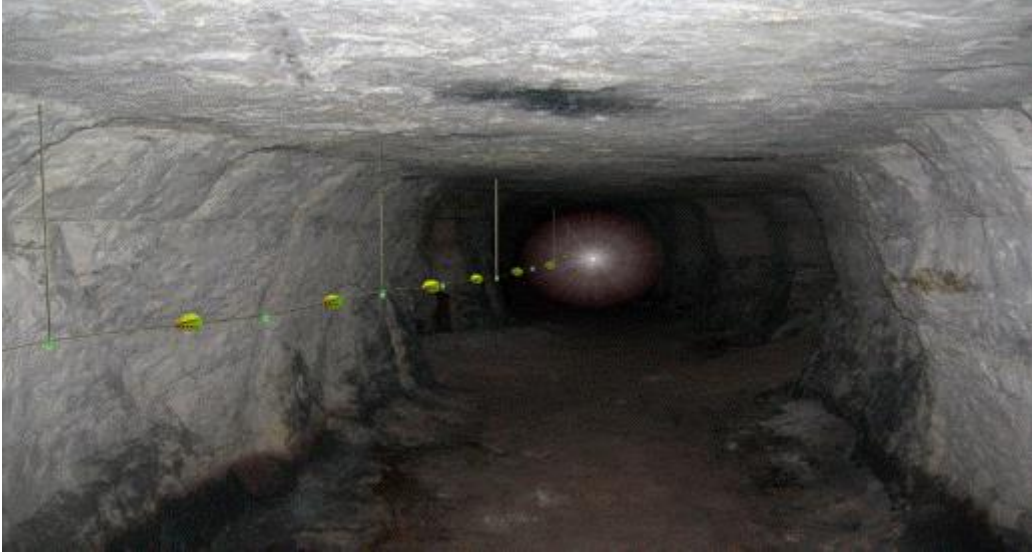
Şekil-1: Hayat hattı görünümü

18.1. Hayat hatlarının acil durumlarda kullanımına ilişkin, çalışanlarda davranış değişikliği sağlayacak şekilde eğitimler verilir.